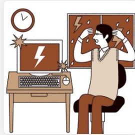
落雷による家財の損害 ご選択された家財保険金額

※賠償責任保険においては、借家人賠償責任と個人賠償責任の2つをあわせて1事故の支払限度額が1,000万円となります。