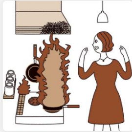
失火等による借家人賠償責任 1,000万円※