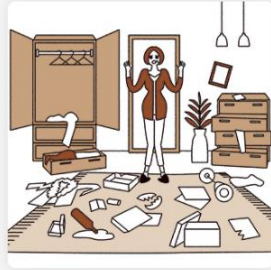
空き巣による家財の盗難 一事故50万円